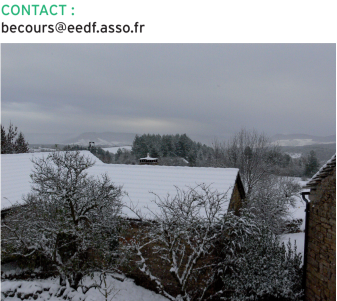
CGAB du 27 & 28 Novembre, la neige !